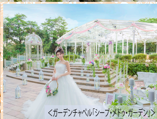
<ガーデンチャペル「シーブ・メドウ・ガーデン」>